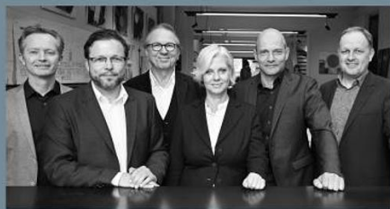
Berschneider + Berschneider, Architekten BDA + Innenarchitekten „Anspruchsvolle Architektur aus einem Guss.“

Wir verwandeln Träume in Bauwerke – durch Planung, Inspiration, Handwerk und Know-how – und sind Ihr zuverlässiger Partner.