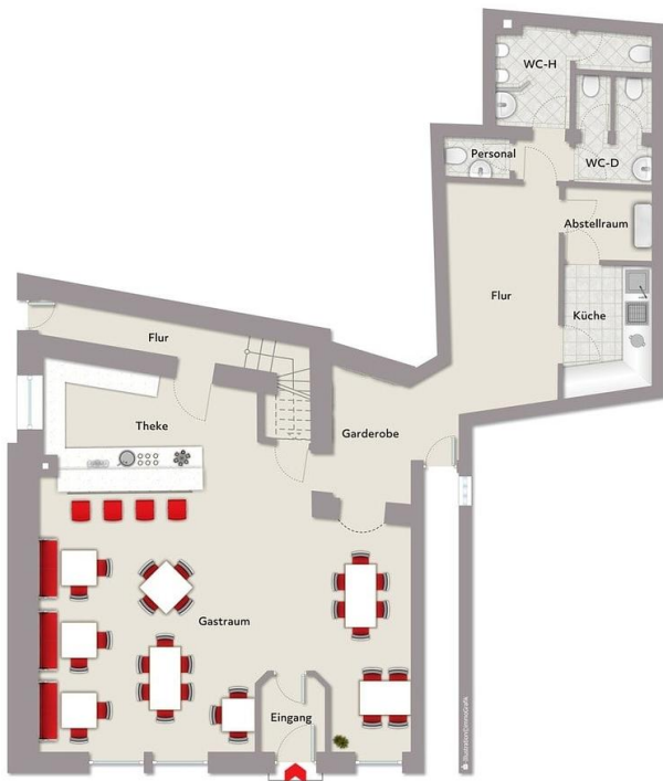
Exemplarplan, nicht maßstäblich