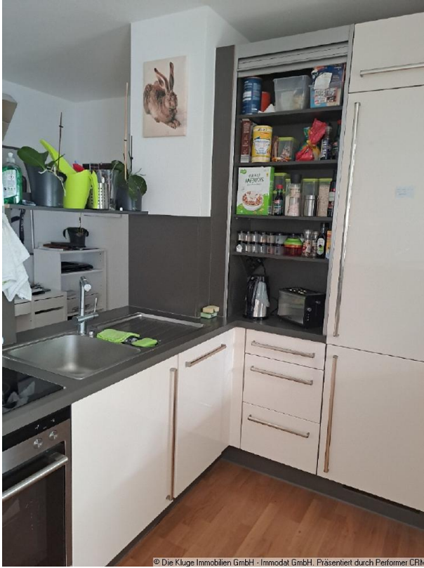
© Die Kluge Immobilien GmbH - Immodat GmbH. Präsentiert durch Perlemer CRM