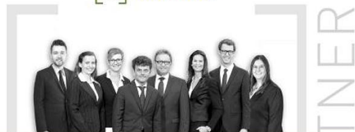
Kirsch & Häubner Immobilien, Neumarkt „Sie entscheiden – wir kümmern uns um den Rest!“