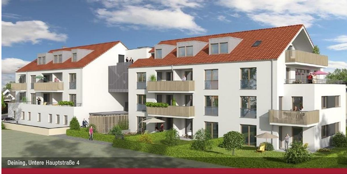
Deining, Untere Hauptstraße 4